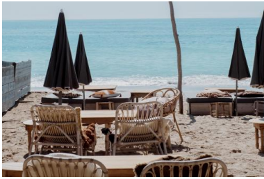
La plage privée Bonaventure à Palavas-les-flots.

Au-delà des aspects financiers, la confusion public/privé a aussi contaminé l'ambiance de travail autour de la députée, selon l'enquête. Le rapport de synthèse pointe, à ce titre, les « demandes inappropriées » faites par Coralie Dubost auprès de son équipe parlementaire pour des « tâches relevant de la sphère personnelle ou en limite des sphères professionnelle et personnelle régulièrement demandées, et ne rentrant pas dans les attributions récurrentes, normales et attendues d'un poste de collaborateur et collaboratrice de député ».