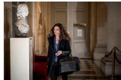
Coralie Dubost à l'Assemblée nationale, en février 2020.

Sollicitée par Mediapart, la députée explique avoir désormais tout remis en ordre, en procédant à des remboursements de frais indus, après avoir fait l'objet, pour les années 2018 et 2019, d'un contrôle opéré par la déontologue de l'Assemblée nationale.