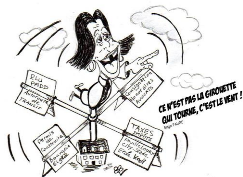
Dessin : Saintryinfo.fr

Etait-il bien nécessaire de procéder à cette acquisition pour laquelle il a fallu passer par l'emprunt ( 850.000 € hors frais de notaire et hors aménagements (mise aux normes sécurité - d'accès, etc.)), alors même que la commune n'a aucun projet concret à nous présenter en matière d'utilisation de ce terrain. Seule initiative « coûteuse » : La pose d'un portillon électrique en lieu et place du portillon manuel au bout de la résidence « Saintry-Plaisance ».