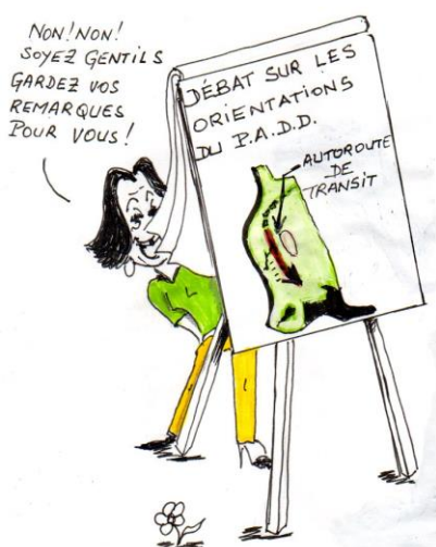
Dessin : Saintryinfo.fr

Il a été proposé de réserver une enveloppe de 1.500.000 € afin de procéder aux travaux d'agrandissement du réfectoire, de rénovation thermique et de mise aux normes en matière d'accessibilité à tous les handicaps, sans fournir la moindre étude au conseil municipal, comme si Mme le Maire avait été touchée par le Saint-Esprit qui lui aurait soufflé à l'oreille le montant de cette dépense.